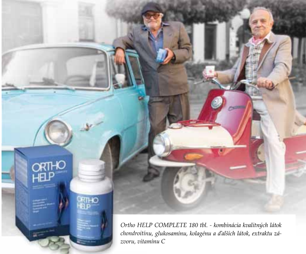
Ortho HELP COMPLETE 180 tbl. - kombinácia kvalitných látok chondroitínu, glukosamínu, kolagénu a ďalších látok, extraktu zázvoru, vitamínu C

diagnózy lekár určí pacientovi adekvátnu farmakologickú liečbu, ktorú zahŕňajú paracetamol, nesteroidné protizápalové lieky (tzv. NSAID), glukokortikoidy alebo biologická liečba či pre dané ochorenie špecifické lieky ako napr. chorobu modifikujúce antireumatiká a podobne. V prípade osteoartrózy je možné uvažovať nad chondroprotektívami (kyselina hyalurónová, chondroitínsulfát, glukozamín), z ktorých mnohé sú dostupné aj voľnopredajne v lekárňach a ich účinok pretrváva niekoľko týždňov aj po vysadení liečby. Od bolesti kĺbov vyvolaných pádmi, nárazmi či podvrtnutiami si vieme uľaviť rýchlym znehybnením končatiny a dostatočným chladením postihnutého miesta. Ani v tomto prípade však nie je múdre vynechať vyšetrenie lekárom, aby sme vlastným zľahčovaním úrazu nepodcenili situáciu, ktorá môže vyústiť do závažných chronických dôsledkov. Na tlmenie bolesti je možné zvoliť už spomínané lieky s paracetamolom, prípadne NSAID. Na trhu je